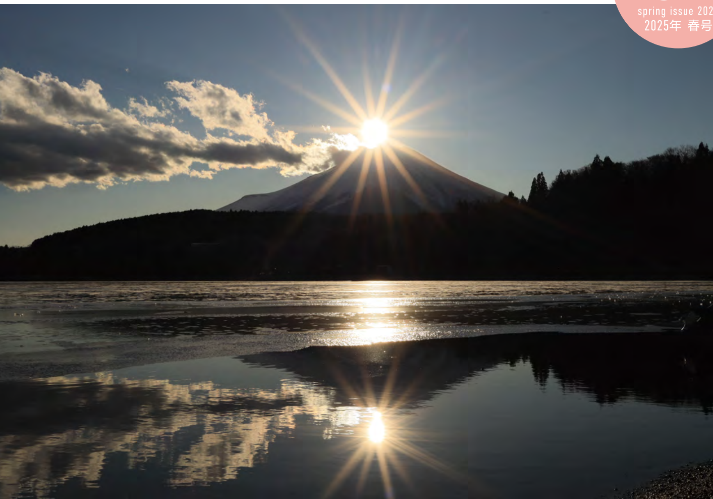
「ダブルダイヤモンド富士／山中湖」